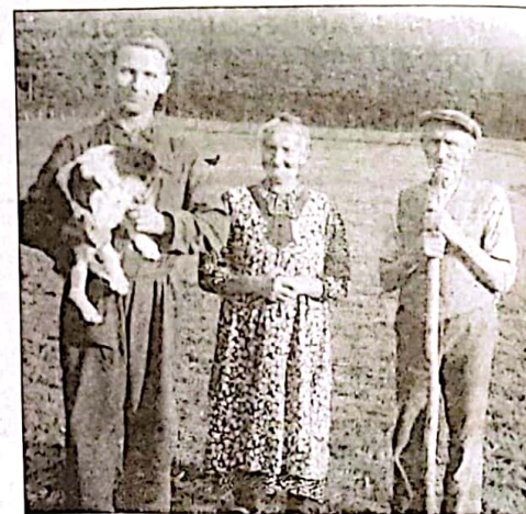
'Brookstrui' uit Borgnbos, de ijzersterke verzetsvrouw bij wie gedropte wapens verstopt werden