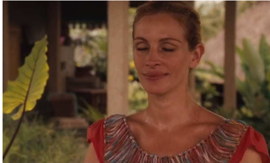
Eat, Pray, Love